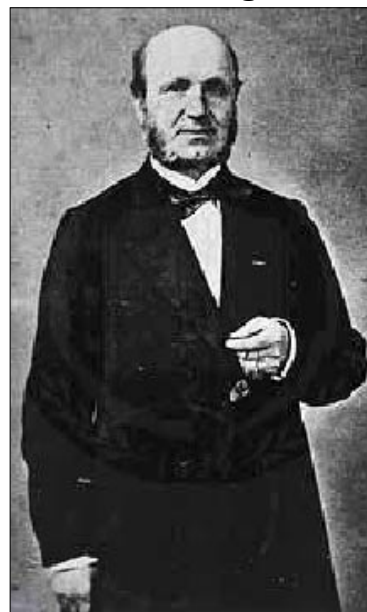
شکل ۲: گیوم بنیامین آماند دوشن

نکروپسی عضله به گلبول‌های چربی، ذرناسیون گرانولار، و تخریب فیبرهای مخطط اولیه اشاره کرد که بی‌شک نشانگر جایگزینی چربی و بیماری پیشرفته رشته‌های عضلانی است. بنابراین، مریون این دیستروفی را ده سال پیش از دوشن شرح داده است.